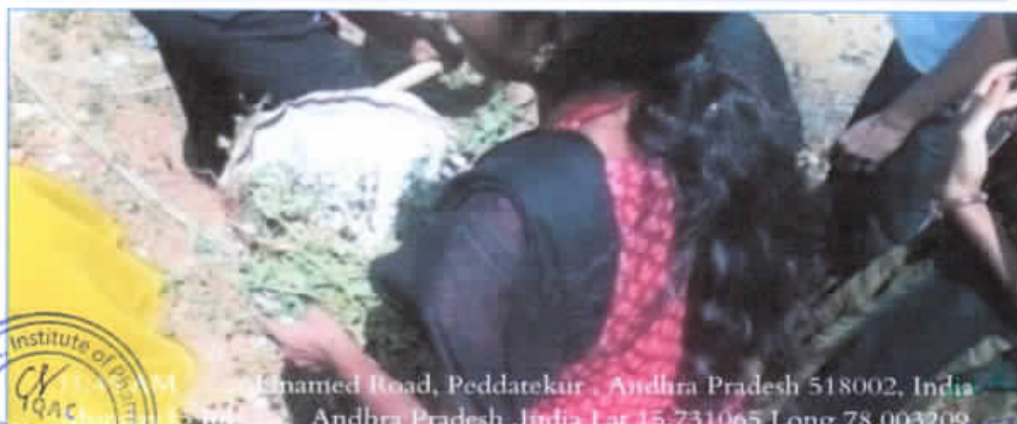
Unamed Road, Peddatekur , Andhra Pradesh 518002, India Andhra Pradesh ,India Lat 15,731065 Long 78,003209