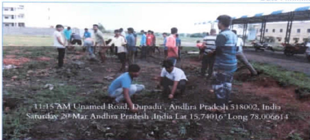
11:15 AM Unamed Road, Dupadu , Andhra Pradesh 518002, India Saturday 20 Mar Andhra Pradesh ,India Lat 15,74016° Long 78,006614