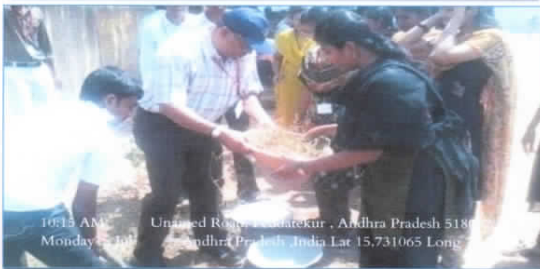
10:15 AM Unamed Road, Peddatekur , Andhra Pradesh 518002, India Monday 2 Jul Andhra Pradesh ,India Lat 15,731065 Long 78,003209