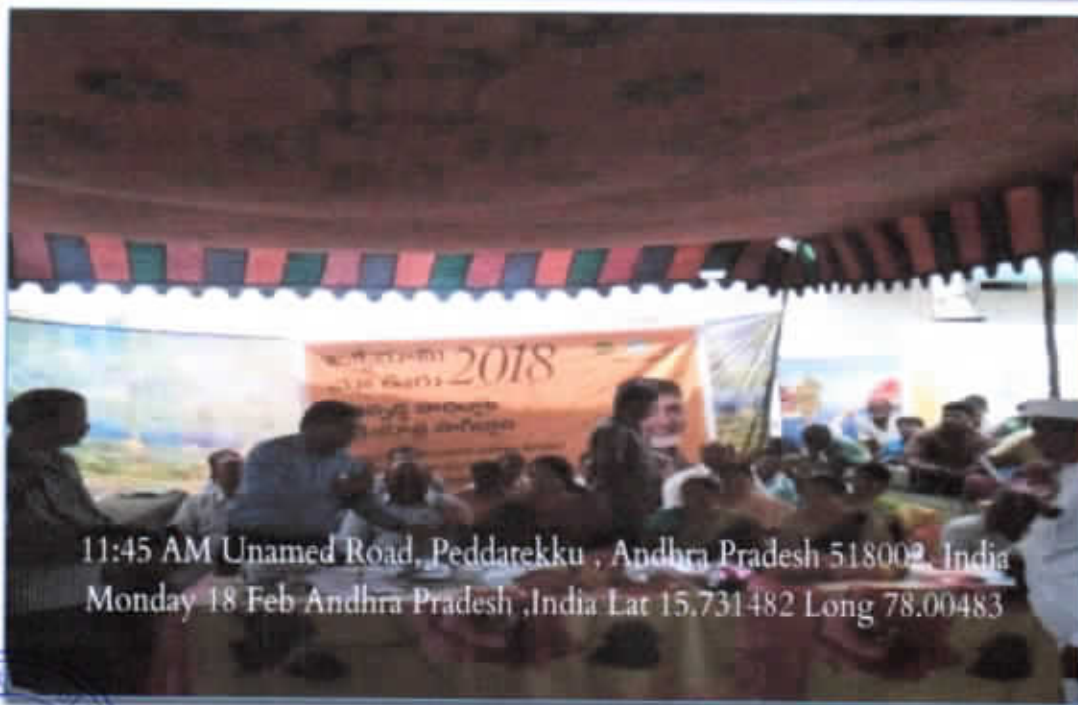
11:45 AM Unamed Road, Peddatekku , Andhra Pradesh 518002, India Monday 18 Feb Andhra Pradesh ,India Lat 15.731482 Long 78.00483