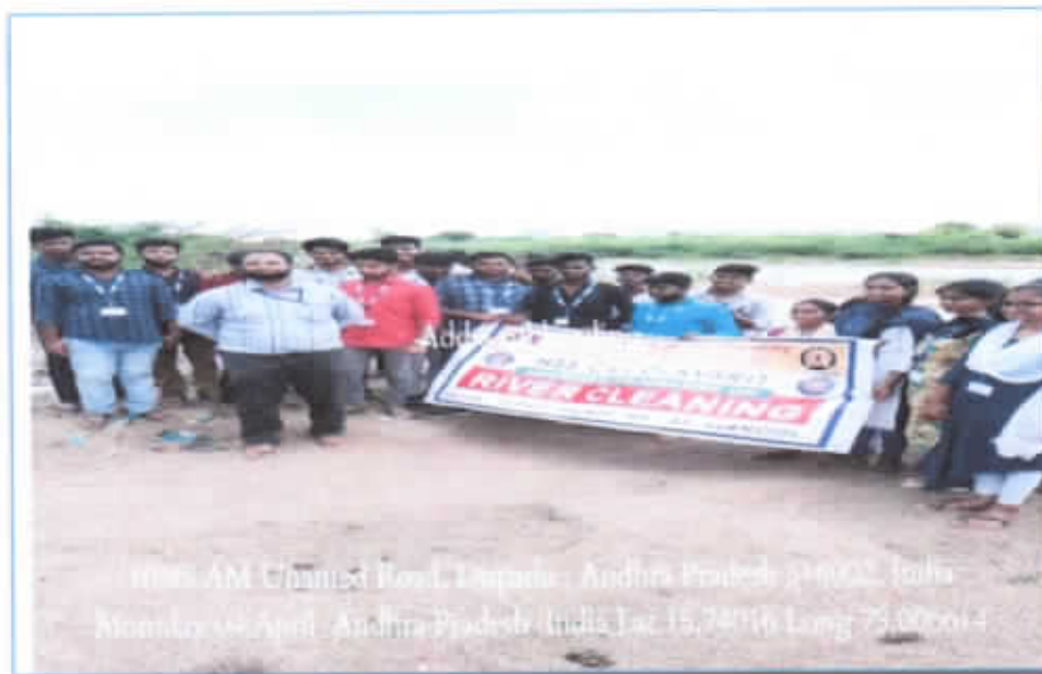
RIVER CLEANING AT B.THANDRAPADU VILLIAGE